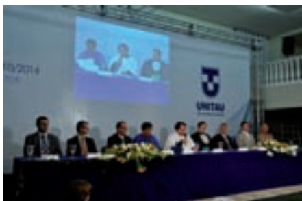
Mesa diretora da Sessão Solene de Posse.