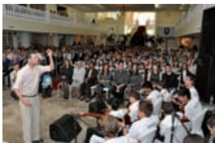
Apresentação da Orquestra de Cordas de São Bento de Sapucaí.